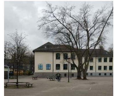
Schulleiter auf dem Schulhof während der Schulschließung: ziemlich einsam...

Liebe Eltern und Erziehungsberechtigte, liebe Schülerinnen und Schüler, das abgelaufene Schuljahr 2019/2020 wurde überschattet von der Corona-Pandemie. Dass alle Schulen für viele Wochen geschlossen wurden, hatte es vorher noch nie gegeben. Was anfangs wie die Erfüllung des Traums aller Schüler aussah, zeigte sich bald eher als Alptraum. Denn dass die Kinder wochenlang zuhause bleiben mussten und sogenannte Distanzaufgaben erledigen sollten, war eine große Belastung und Herausforderung für Schüler, Eltern und Lehrer. Für einen Jubel „Hurra, die Schule fällt aus!“ gab es auch angesichts der Bedrohung durch das Virus keinen Anlass – und der Verzicht auf das gemeinsame Lernen in der Schule, auf Kontakte, Austausch, Gespräche, Sport und gemeinsames Spiel gefiel bald niemandem mehr.