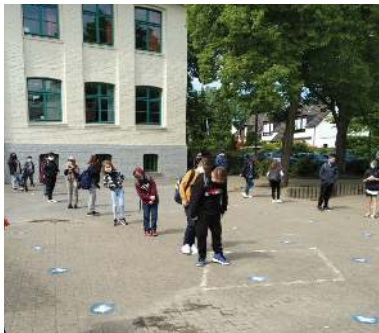
Schüler auf dem Schulhof während der Schulöffnung: ziemlich vereinzelt...

Glücklicherweise hatten wir als Talentschule vor dem „Lockdown“ noch das Programm IServ für alle Schüler einrichten können. Dadurch war es Schülern und Lehrern möglich, reibungslos zu kommunizieren. Die Lehrer konnten die geforderten „Distanzaufgaben“ erteilen und Rückmeldungen dazu geben. Die Schüler konnten Fragen stellen, sich austauschen, Fotos ihrer Texte oder Videos schicken oder an Videokonferenzen teilnehmen. Und die Lehrer machten eine besondere und so nicht erwartete Erfahrung: Sie waren geradezu überwältigt von den vielen erledigten Aufgaben, Texten, Präsentationen usw. Unsere Schüler (und Eltern) haben sich wirklich mächtig ins Zeug gelegt!